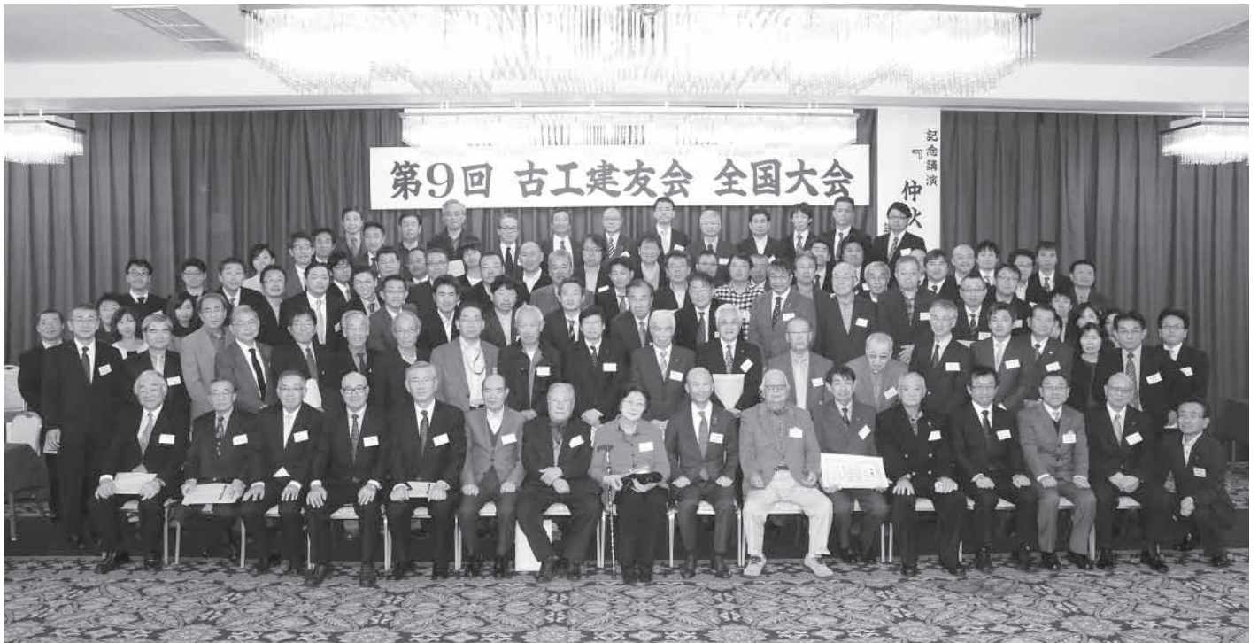
平成29年11月11日(土) 参加者111名！ 於：グランド平成(大崎市古川)